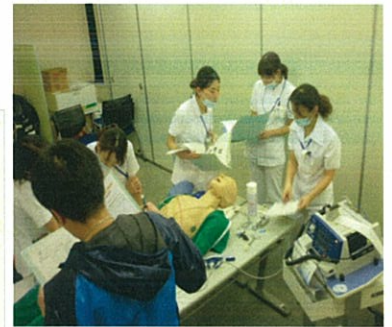
自己学習(グループワーク)

講義で十分な知識を得た後は、実際の現場を再現した実習で学びます。自分の振り返りの場として実習室を活用し、さらに技術を鍛錬することが可能です。