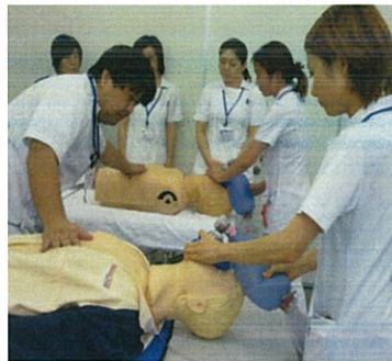
根拠に基づいた講義